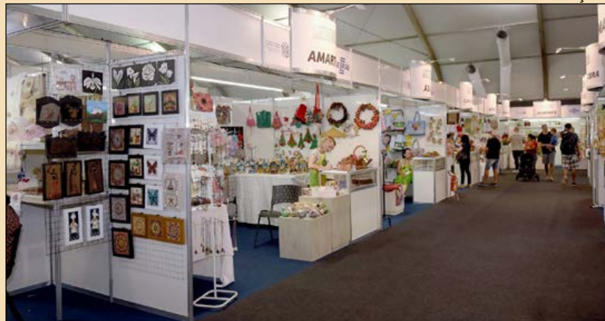
Criada em 2013, a ArteSanto conquista seu espaço no calendário de eventos do segmento, sendo referência no Espírito Santo e no país