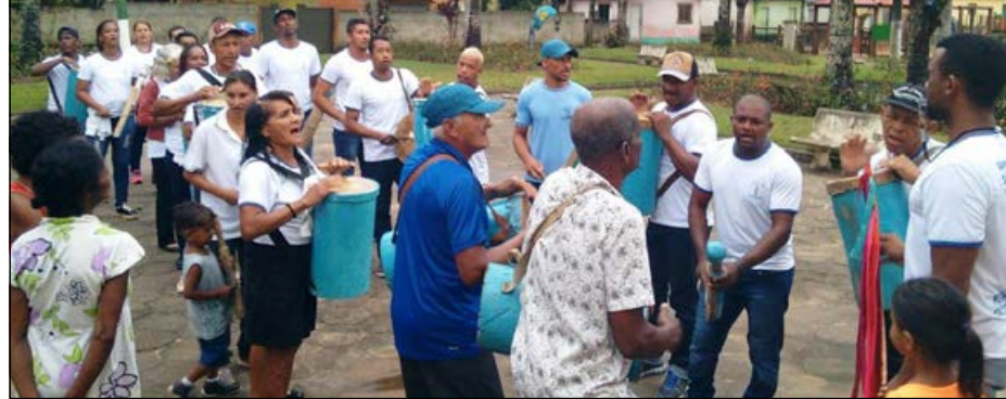
Moradores e banda de congo de Povoação prestam homenagem a São Benedito, o padroeiro da comunidade

A comunidade de Povoação, em Linhares, recebeu o 5º Encontro Cultural e Folclórico nos dias 15, 16 e 17 de novembro. O evento contou com