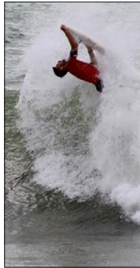
Atletas de vários estados participaram da competição

Participaram atletas capixabas e dos Estados de Alagoas, Bahia, Ceará, Pará, Paraná, Pernambuco, Rio de Janeiro, Rio Grande do Norte, Rio Grande do Sul, Santa Catarina e São Paulo. As dispu-