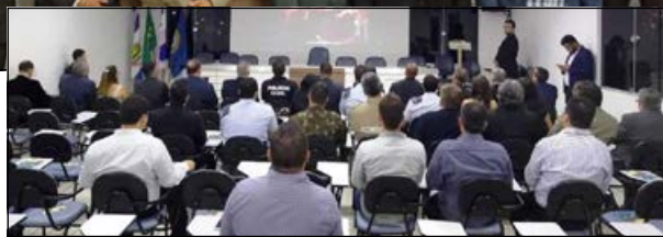
Um bom público e várias autoridades acompanharam os trabalhos

A Associação dos Diplomados da Escola Superior de Guerra (Adesg) promoveu o 2º Seminário de Segurança Pública, no auditório da Ordem dos Advogados do Brasil (OAB), no bairro Três Barras, em Linhares. Um bom público e várias autoridades acompanharam os trabalhos.