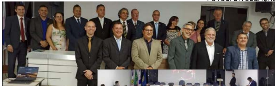
Diretores da Adesg Linhares e outras autoridades no fim do seminário