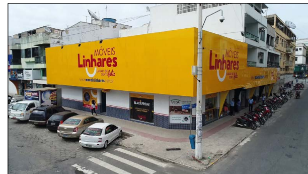
Móveis Linhares no Centro de Linhares; a rede possui 16 lojas no Espírito Santo e sul da Bahia