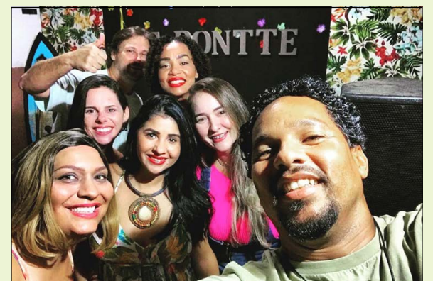
O Le Ponttê Petiscaria propõe ambiente familiar e momentos felizes

Situada na orla, a Cabana Nazaré destaca nas redes sociais: “Vamos juntos valorizar o nosso amado balneário”. A casa sugere três passos para começar o