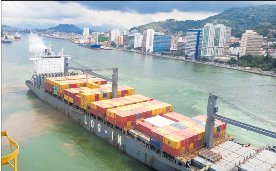
O Espírito Santo recebeu no dia 20 R$ 115 milhões do governo federal a título de compensação pela Lei Kandir, relativo ao ano de 2020