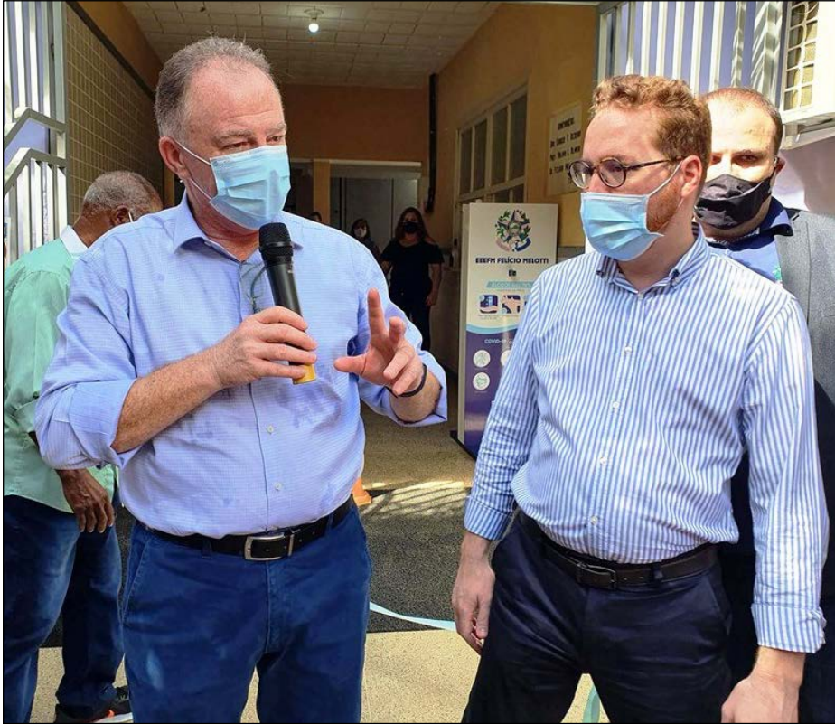
O governador Renato Casagrande, terça-feira (26), em São Roque do Canaã

O governador Renato Casagrande esteve terça-feira (26) em São Roque do Canaã para inaugurar obras em es-