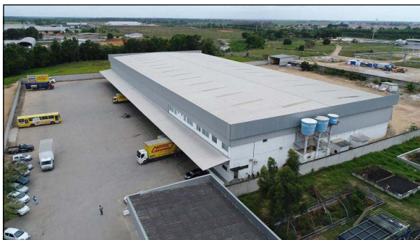
O complexo de distribuição da Móveis Linhares terá sua área duplicada para 12 mil metros quadrados

O item mais vendido foi o fogão, cujas vendas praticamente dobraram em 2020. Esse fenômeno, observa Léo Conti, deve-se ao fato de as pessoas estarem mais atentas as suas necessidades domésticas, por passarem mais tempo em casa nesse período