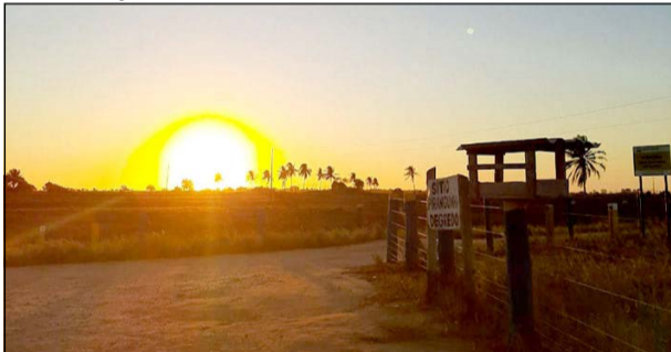
Projeto conta com a capacitação para criação de abelhas nativas sem ferrão e busca a produção de mel e derivados

O projeto de geração de renda para famílias do Degredo a partir da meliponicultura conta com a capacitação para criação de abelhas nativas sem ferrão e busca a produção de mel e