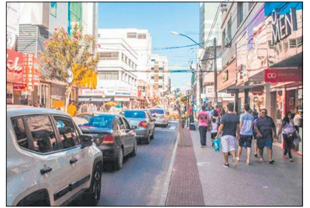
O faturamento do varejo deve ter alta de 9,8% em relação a igual período do ano passado

O ramo de supermercados deve ser o destaque no Natal deste ano, respondendo por 38,5% (R$ 22,11 bilhões) do volume total, seguido pelos estabelecimentos de vestuário, calçados e acessórios, com 35,3% (R$ 20,28 bilhões) e pelas lojas de artigos de uso pessoal e doméstico, com 13,2% (R$ 7,6 bilhões).