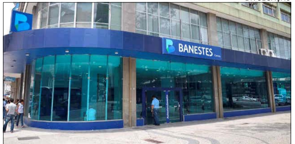
No ranking geral das maiores e melhores empresas do Estado, o Banestes se classificou na 9ª posição

Banestes Distribuidora de Títulos e Valores Mobiliários (Banestes DTVM). A empresa subsidiária do Banestes S.A obteve o 4º lu-