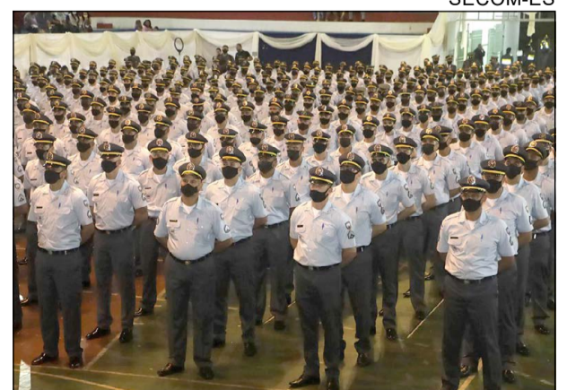
A formatura dos sargentos foi realizada no bairro Forte São João, em Vitória

Em sua fala, o governador destacou o trabalho de reestruturação das forças de segurança no Espírito Santo. “Estamos caminhando para fecharmos o ano de 2021 e todo o período de gestão com o menor número de homicídios desse Estado. Agradeço a todos vocês que estão na linha de frente”, disse.