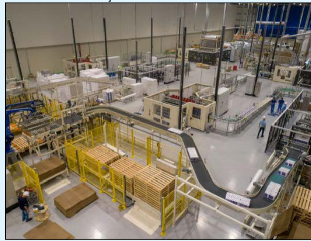
Linha de produção de papel tissue

A produção industrial do Espírito Santo no acumulado de ja-