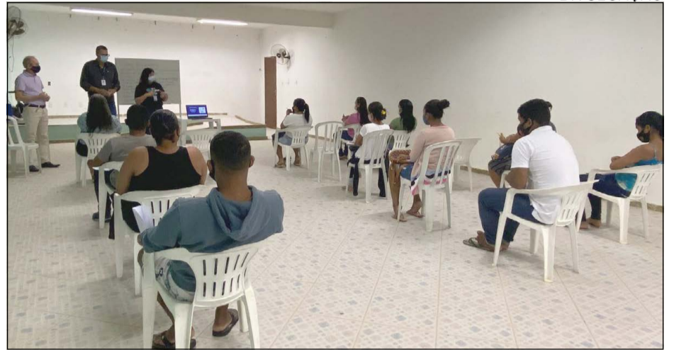
As aulas são ministradas nas comunidades de Regência e Povoação

A partir de janeiro de 2022, novas turmas e cursos estão previstos para serem abertos. As vagas serão divulgadas nas comunidades, e a população também poderá acompanhar as oportunidades por meio dos canais oficiais de comunicação da Fundação Renova.