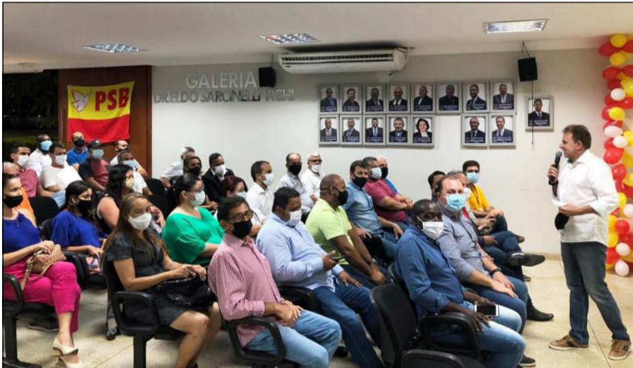
O encontro dos socialistas e convidados foi realizado quinta-feira (16) na câmara municipal

O PSB de Linhares promoveu encontro no dia 16, na câmara municipal. Filiados, vereadores, lideranças do partido e convidados conversaram sobre o cenário para as eleições de 2022 e discutiram o possível lançamento de candidaturas.