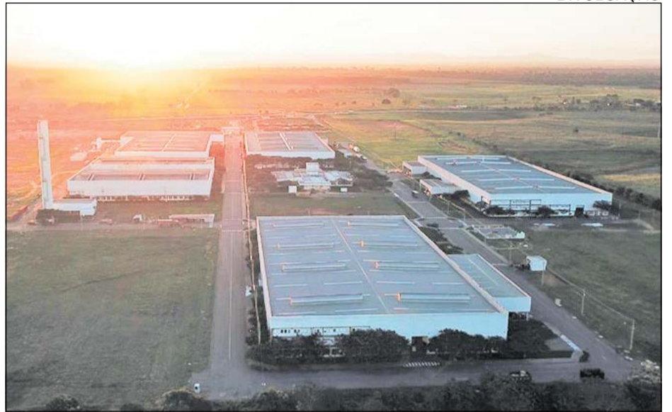
Linhares atrai empreendimentos industriais como a Weg Motores

O potencial turístico passa pelas praias e lagoas, reservas naturais e pelo agroturismo. O município tem o maior litoral do Estado e um dos maiores complexos lacustres do Sudeste brasileiro. São mais de 60 lagoas, entre elas, a Juparanã, a segunda maior do Brasil em volume de água.