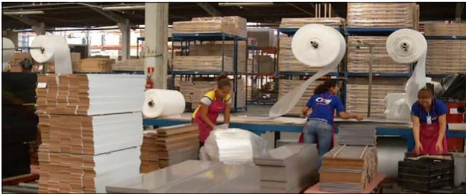
Linhares possui o maior pólo moveleiro do Estado e um dos mais estruturados do Brasil

Linhares ocupa uma posição importante na economia capixaba. Destaca-se na agropecuária – diversificada e moderna. É um grande produtor de leite e o maior produtor de cacau do Espírito Santo. Também produz bastante mamão, cana de açúcar, laranja, maracujá, café, pimenta do reino, banana, coco e outras culturas.