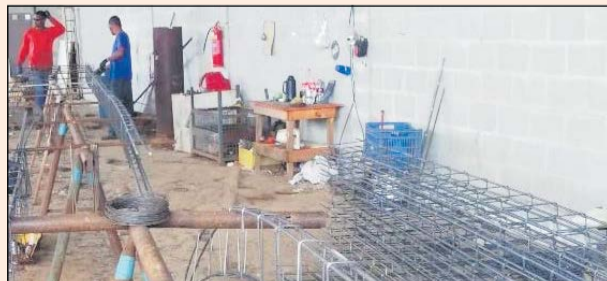
A KL trabalha com colunas, esteiras, treliças, colunas prontas e ferragens em geral