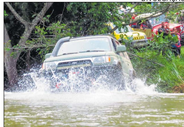
O evento de Off-Road 4x4 e os shows ocorrem de sexta (19) a domingo (21) no balneário

Neste sábado (20) a programação tem início às 7h30 com um café da manhã entre os inscritos no evento. Em seguida os jipeiros farão uma trilha com destino à comunidade de Degredo, mas os veículos não irão passar nas áreas de restinga e de preservação ambiental das localidades. À noite tem shows com as bandas Sambolada e Retrô Rock, no trio elétrico, na Pri-