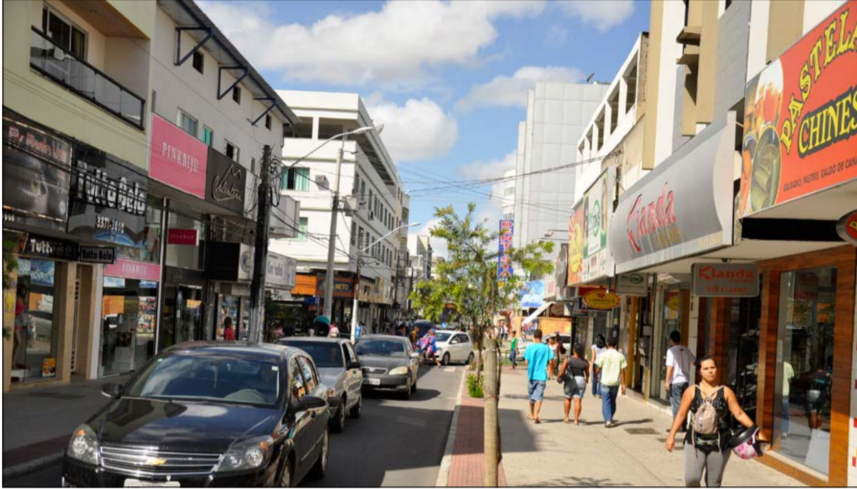
A sede do município apresenta topografia plana e ruas e avenidas largas

Situado no Norte do Espírito Santo, Linhares ocupa uma área de 3.496.263 quilômetros quadrados, a maior dentre os municípios do Estado. Pos-