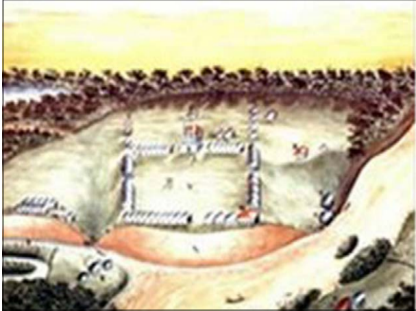
Vista e perspectiva do Povoado de Linhares em 1819

Em 1800, para proteger os moradores (e outros que viriam) dos índios, o governador da Capitania do Espírito Santo, Anto-