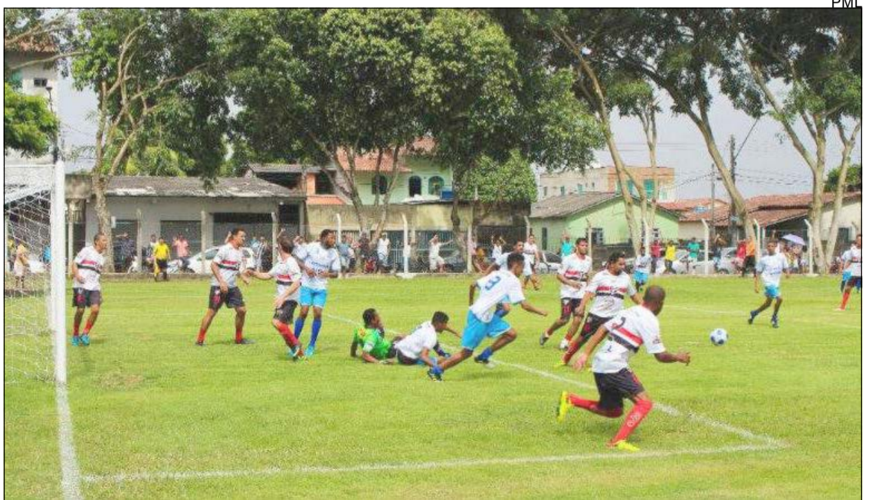
O Torneio do Trabalhador é um dos eventos expressivos de Linhares

Além da exuberante natureza e das riquezas culturais, a cidade alia o lazer com o negócio, oferecendo oportunidades. Os investimentos na área de petróleo, as indústrias, o pólo moveleiro e o agronegócio têm feito de Linhares uma cidade em constante desenvolvimento – e atraente para a realização de eventos de vários tipos e voltados para diferentes segmentos.