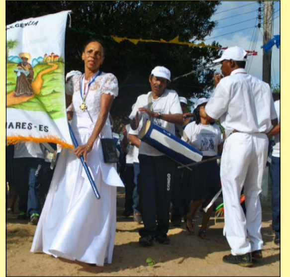
Bandas de congo de Regência e Povoação são referências do folclore do município