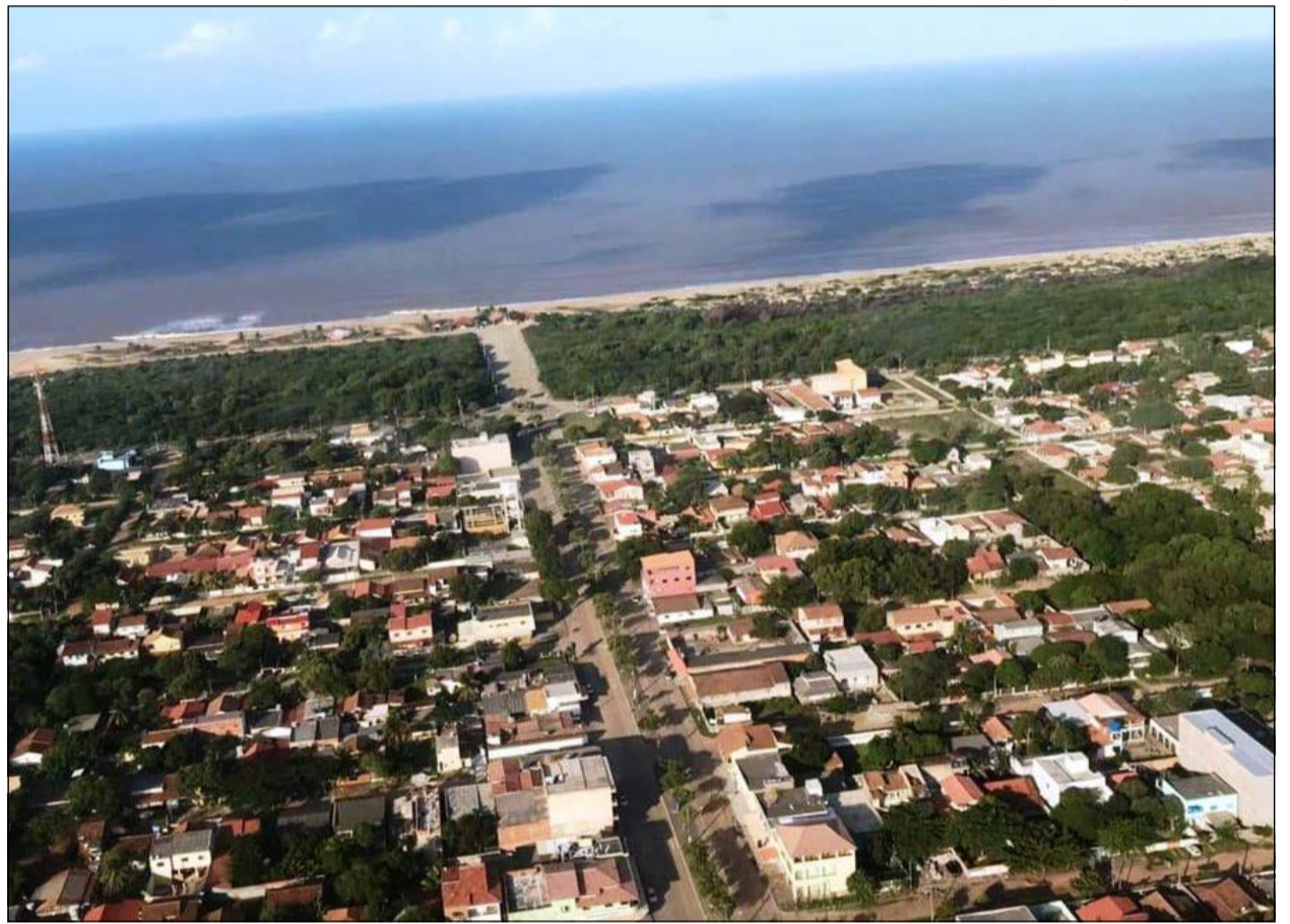
O Pontal do Ipiranga fica a 48 quilômetros do Centro de Linhares e está em franco crescimento

A Reserva de Comboios também preserva área de restinga e da Mata Atlântica, onde é possível encontrar animais como quatis, tamanduás, tatus e saguis. O encontro do Rio Doce