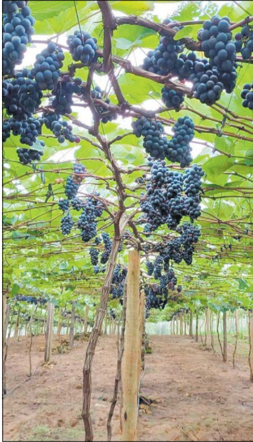
As uvas são produzidas no interior de Linhares