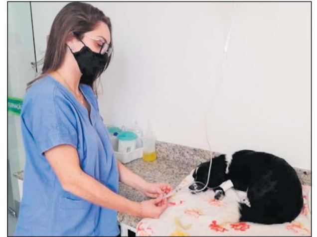
As pré-inscrições estão abertas e irão contemplar mais 600 animais, entre cães e gatos, em 2023

o programa foi lançado Linhares começou a es- crever uma nova história voltada para o bem-estar animal. “Não é só castração, mas dignidade, garantia de direitos e reconhecimento da importância dos protetores de animais para a causa. O programa foi construído com a ajuda da sociedade”, disse.