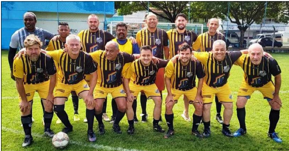
Amigos disputaram uma animada partida no campo do Vasquinho

O esperado encontro entre Solteiros X Casados do Bairro Novo Horizonte (BNH), em Linhares foi realizado com sucesso neste mês. O evento teve início às 8h30, com partida no campo do Vasquinho, no bairro Interlagos, e prosseguiu às 11 horas na Arena Futebol,