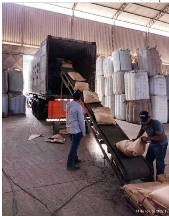
A carga saiu de Vila Valério para o porto de Itaguaí (RJ) e de lá para o Egito

Só ficou atrás do Vietnã, responsável por 41,5% da comercialização global, de acordo com a Câmara de Comércio Árabe-Brasileira. No Brasil, a produção sempre esteve concentrada no Pará, Espírito Santo e Bahia. Nos últimos anos o Espírito Santo ultrapassou o Pará e se tornou o maior produtor do país, conforme dados do Instituto Capixaba de Pesquisa, Assistência Técnica e Extensão Rural (Incaper).