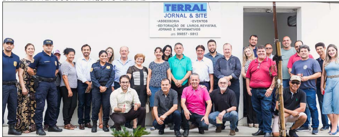
Representantes de diversos segmentos na sede da D. Porto Editora