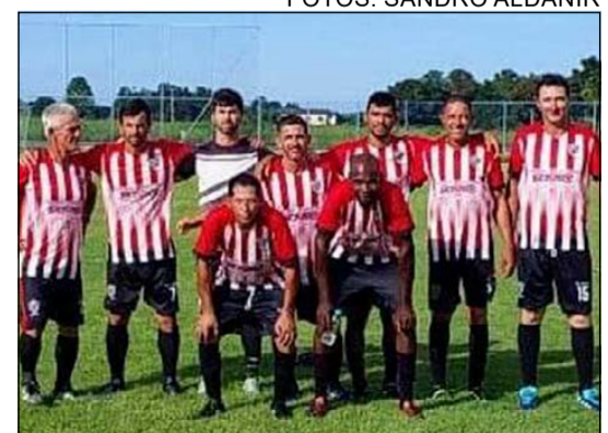
O União e a Bagueira fizeram um animado jogo