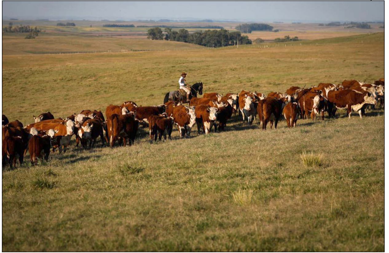
A publicação do IJSN mostra que a agropecuária teve crescimento de +25,8% em 2020

O estudo revela ainda que oito das dez microrregiões capixabas registraram expansão no valor do PIB em 2020. A região metropolitana computou o maior crescimento por influência de Viana e Vitória, seguida da central sul, que foi impactada principalmente por Castelo.