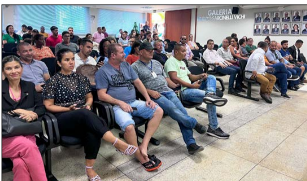
O público prestigiou a sessão