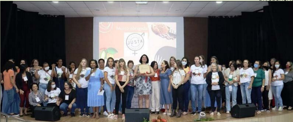
Mulheres do cacau apresentaram os resultados obtidos para a sociedade

Cacaucultoras da região norte do estado se reuniram no dia 16 em Linhares em mais uma ação do Projeto Mulheres do Cacau. Elas apresentaram os resultados obtidos até aqui para a sociedade e res-