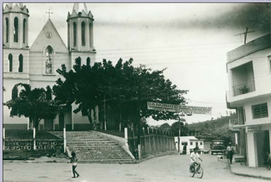
O Oscip tem como uma das atribuições preservar o patrimônio natural e cultural de Rio Bananal

O Centro Cultural e Museu Nova Fatima (Oscip) foi fundado em 17 de outubro de 2012 e registrado no dia 27 de novembro do mesmo ano. É conhecido como Organização Cultural