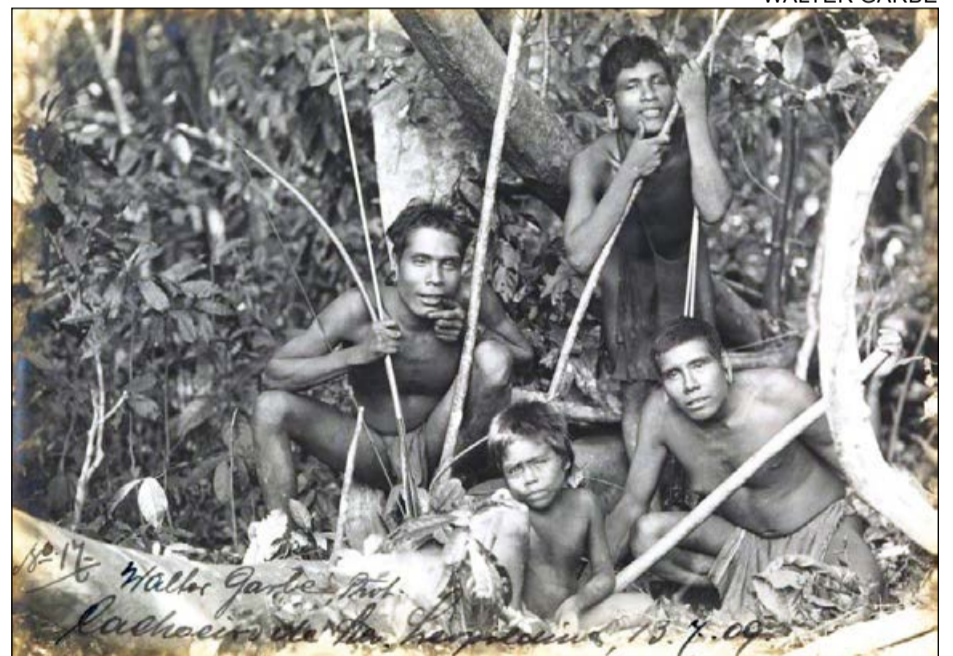
Os índios foram os primeiros habitantes da região

Objetivando a posse inicial da terra, em princípio chamada de terra devoluta, em atenção à política pú-