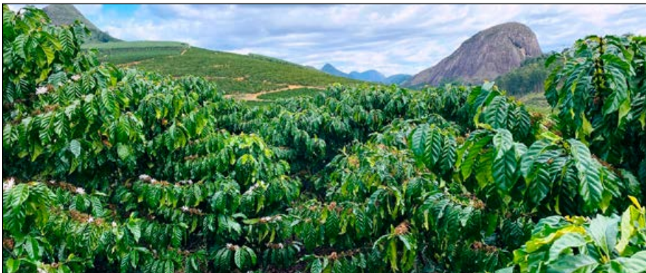
O café é a principal atividade econômica do município

A principal atividade econômica do município é a produção cafeeira, em especial o conilon, que ocupa lugar de destaque no estado e no país. Outras culturas