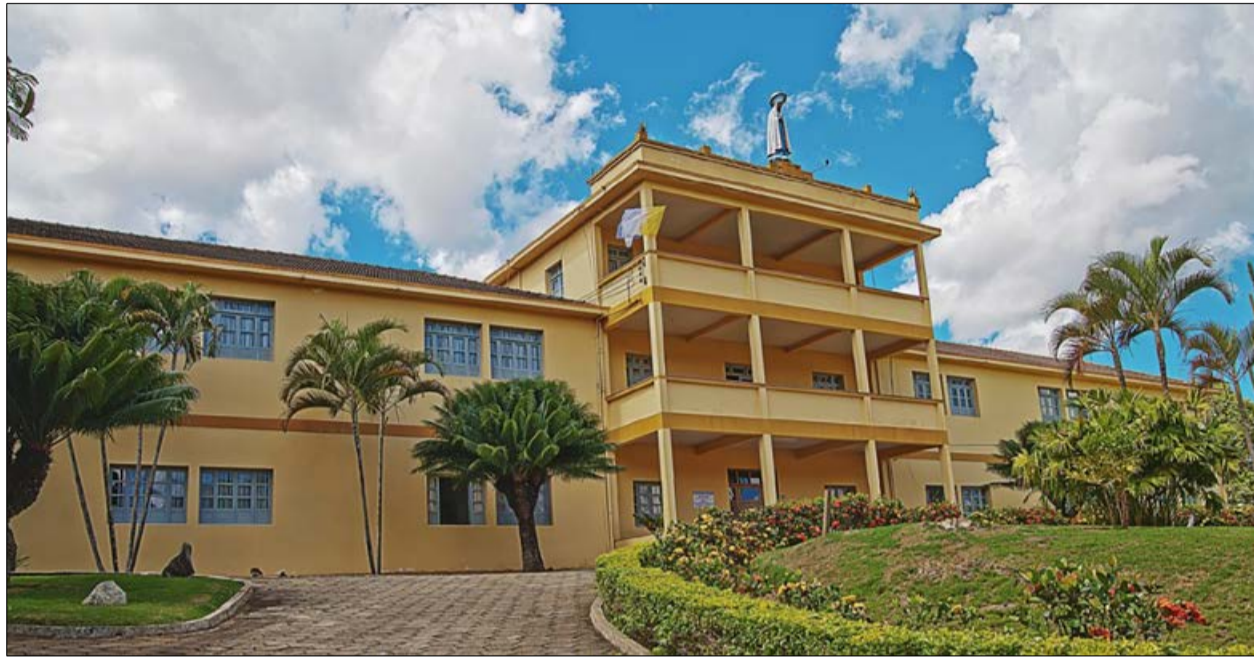
A construção do seminário envolveu a comunidade e contou com recursos da Alemanha e da Itália