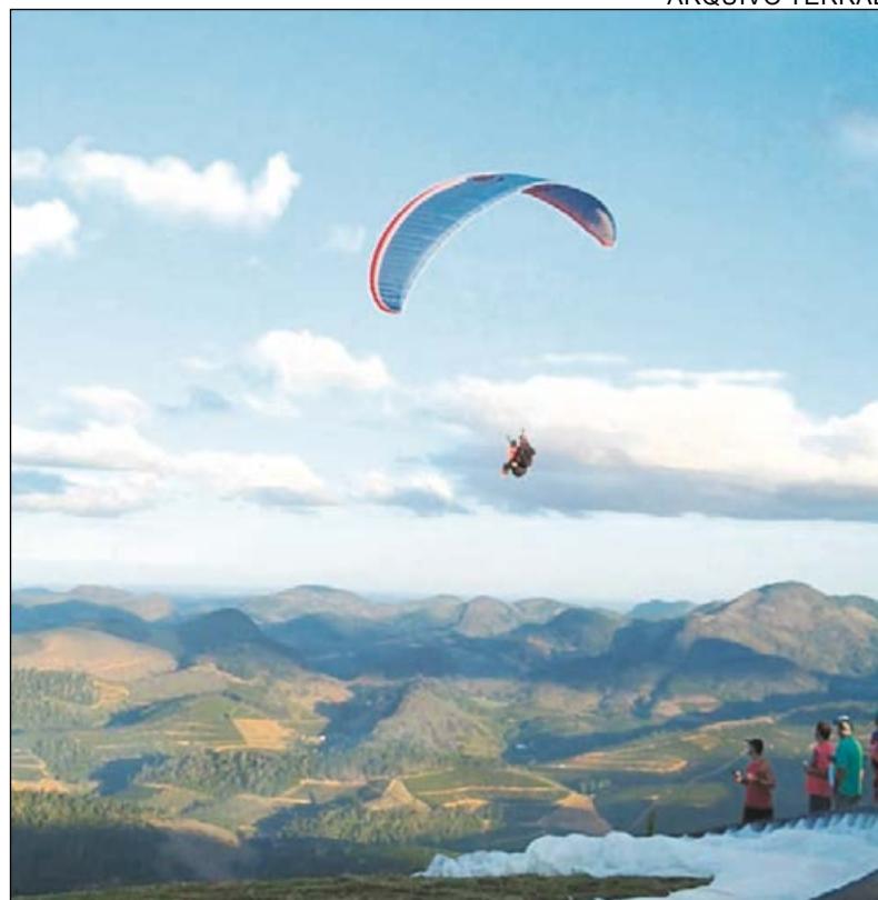
A Rampa do Cleiton atrai cada vez mais pessoas

taca os pontos de decolagem, as condições de voo, os locais próprios para o pouso de pilotos, equipamentos e passageiros, além de outros aspectos importantes do local.