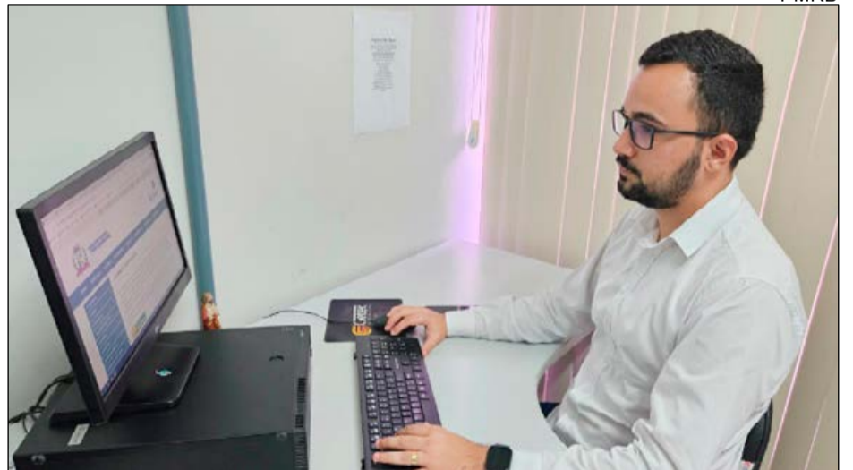
A Prefeitura de Rio Bananal melhorou os seus índices neste ano