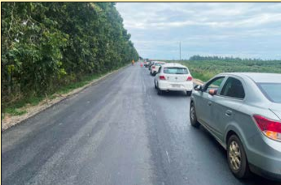
As obras tiveram início após décadas de espera e muitas reclamações de motoristas e moradores