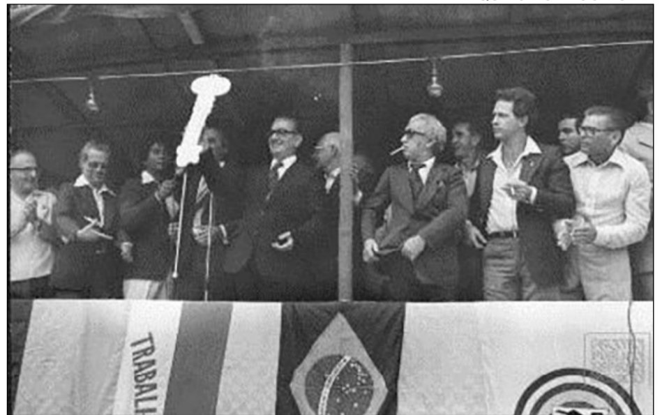
O governador Eurico Vieira de Rezende em Rio Bananal em 14 de setembro de 1979, dia da emancipação

A lei foi assinada pelo governador Eurico Vieira de Rezende em Rio Bananal em 14 de setembro de 1979, no pátio do seminário,