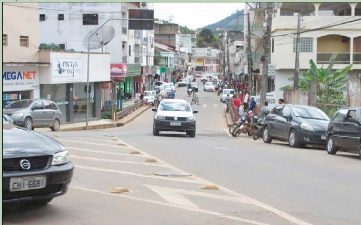
A sede de Rio Bananal conta com os bairros Santo Antônio e São Sebastião

De acordo com o Instituto Brasileiro de Geografia e Estatística (IBGE, 2022), Rio Bananal possui 19.273 habitantes. Está localizado na microrregião do rio Doce, região norte do Espírito Santo, e possui limites geográficos com outros quatro municípios: ao sul e leste com Linhares; oeste com Governador Lindenberg e norte com Sooretama e Vila Valério.