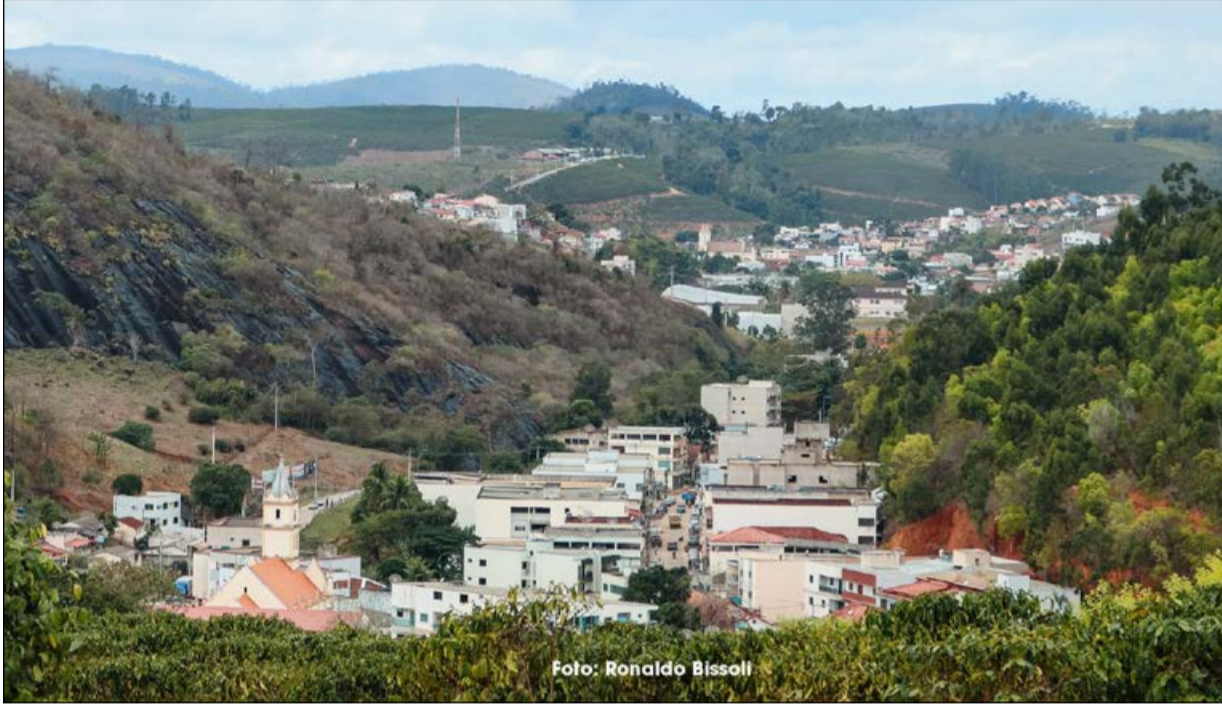
Registro panorâmico de Rio Bananal mostrando igrejas de Santo Antônio e São Sebastião e o seminário

Não se tem com exatidão a data do início do povoamento de Rio Bananal por colonos. Pelas informações obtidas, por volta de 1900 a 1910, alguns “invasores”, como famílias pioneiras de Linhares, já procuravam por aqui terras novas e férteis e madeira de lei, como o jacarandá e a peroba, raras e preciosas.